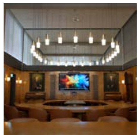
Ystafell y Bwrdd