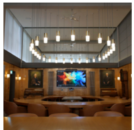
Ystafell y Bwrdd