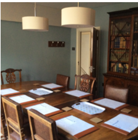
Ystafell Bwyllgor Tom Jones

Am fanylion llogi unrhyw ofod, cysyllter â Swyddfa Pantyyfedwen: 01970 612806 / post@jamespantyyfedwen.cymru