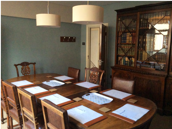
Ystafell Bwyllgor Tom Jones

Am fanylion llogi unrhyw ofod, cysyllter â Swyddfa Pantyfedwen ar 01970 612806 neu post@jamespantyfedwen.cymru .