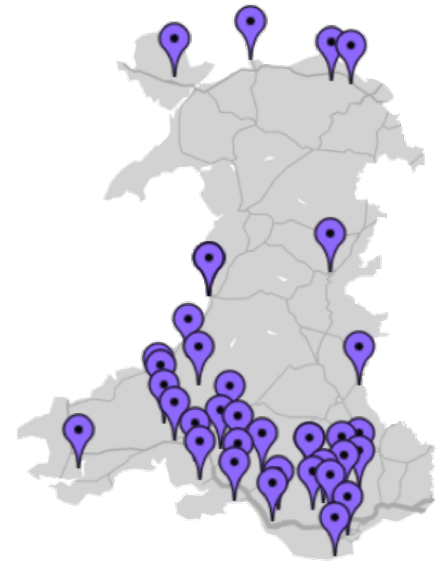
Map yn dangos lleoliad yr eglwysi a dderbyniodd grant yn y blynyddoedd diwethaf

Gwelir yma fap sydd ar y wefan yn dangos lleoliad yr eglwysi a dderbyniodd grantiau yn ystod y blynyddoedd diwethaf ac sydd bellach wedi cwblhau'r prosiect ac anfon adroddiad a lluniau atom. Isod hefyd ceir detholiad o'r prosiectau a gwblhawyd – mae manylion pellach amdanynt i gyd ar wefan yr Ymddiriedolaeth – www.jamespantyfedwen.cymru .