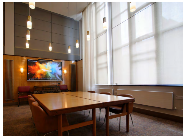
Ystafell y Bwrdd