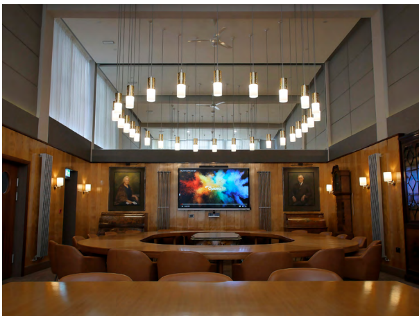
Ystafell y Bwrdd